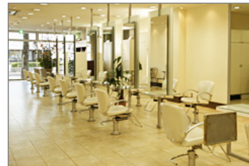
T:R:E:N:T:E(トラント)北浦和店(北浦和)