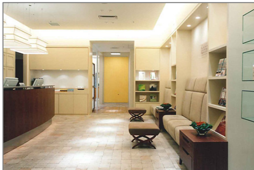
kakimoto.arms (青山・銀座・六本木)