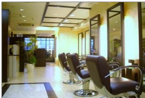
美容室B.C.B.G 和光店 (和光市)