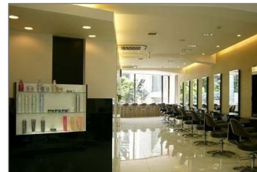
miq Hair&Make up 池袋店(池袋)