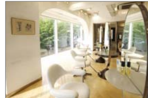
Of HAIR (青山・自由が丘)