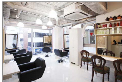
neo arome 新宿駅前店(新宿)