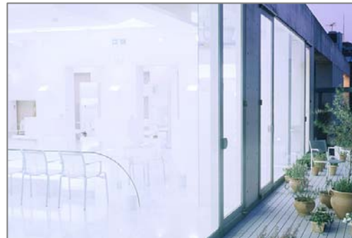
HAIR DIMENSION (青山)